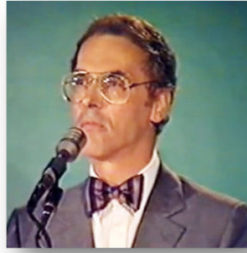
Bernard de Montréal